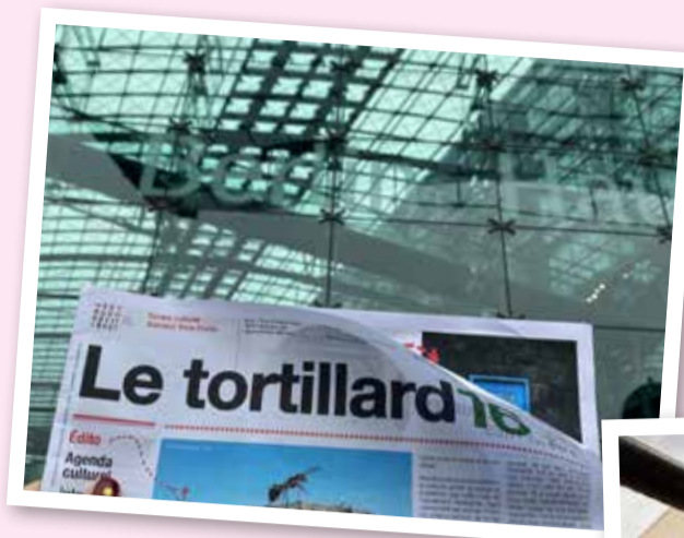
Le Tortillard à Berlin Hbf