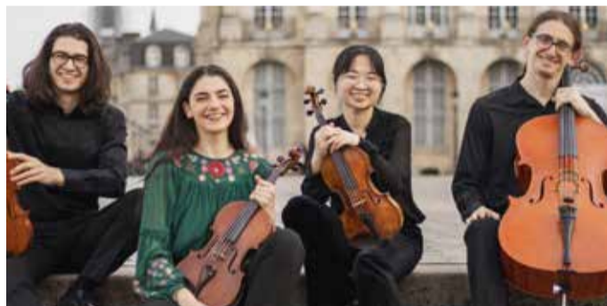
Quartetto Goldberg / © Inis Oirr Asano