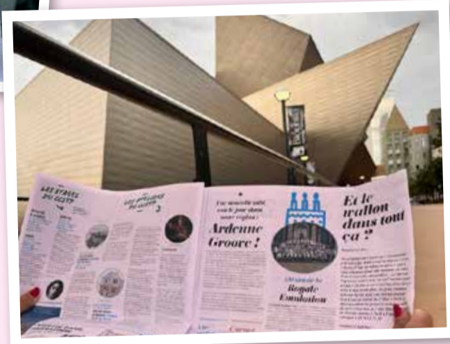
Le Tortillard devant le Centre culturel de Denver (Colorado - USA)

Le Tortillard part en voyage... Faites lui faire le tour du monde et envoyez-nous vos plus beaux clichés.